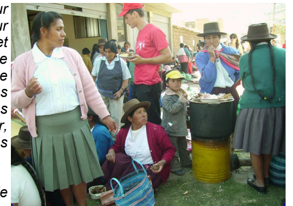
Un repas partagé autour de ce fameux poêle

les aliments ainsi que celle des douches solaires que de plus en plus de paysans nous demandent de fabriquer chez eux. Les populations bénéficiaires, les membres du comité de direction, les travailleurs et les volontaires péruviens de l'Association SEMILLAS DE MUNAY, remercient beaucoup Edelweiss Espoir pour sa contribution. Elle nous aide à utiliser nos ressources naturelles avec mesure, à éviter au maximum la pollution et la disparition de nos arbres et de nos forêts comme celles de l'Amazonie qui constitue