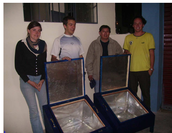
Coopération trans-continentale et développement durable

Tous les pays parlent de stratégies efficaces de lutte contre la pollution et contre le réchauffement climatique.