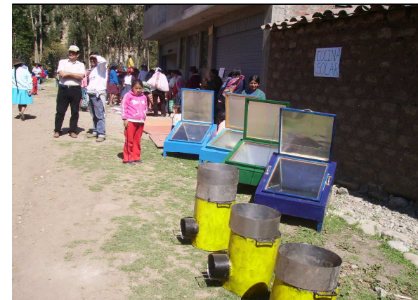
Poêles économiques et fours solaires