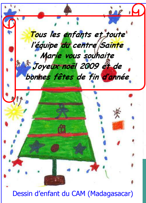
Dessin d'enfant du CAM (Madagascar)

Le conseil d'administration d'Edelweiss Espoir vous présente ses meilleurs vœux pour 2010